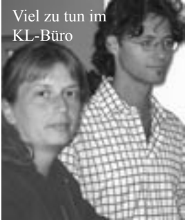
Viel zu tun im KL-Büro

„Zauberhafte“ Osterwoche: 20 Kinder im Alter von 6 bis 15 Jahren, drei BetreuerInnen und drei im Küchen- und Hausteams, schlechtes Wetter, aber tolles Programm und beste Stimmung! So lässt sich die Osterwoche kurz zusammenfassen. Besonderer Höhepunkt war der Besuch der Grazer Uni. Ein Physikprofessor zeigte viele spannende Experimente, die den „Studierenden“ beinahe wie Zauberkünste erschienen.