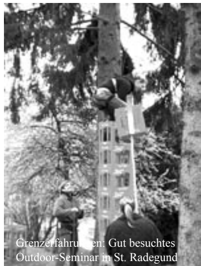
Grenzfahrten: Gut besuchtes Outdoor-Seminar in St. Radegund