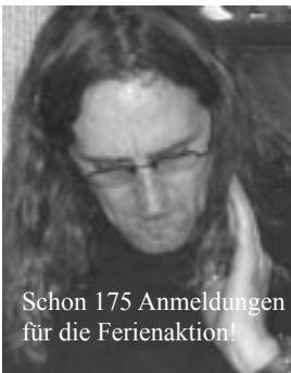
Schon 175 Anmeldungen für die Ferienaktion!

„Zauberhafte“ Osterwoche: 20 Kinder im Alter von 6 bis 15 Jahren, drei BetreuerInnen und drei im Küchen- und Hausteams, schlechtes Wetter, aber tolles Programm und beste Stimmung! So lässt sich die Osterwoche kurz zusammenfassen. Besonderer Höhepunkt war der Besuch der Grazer Uni. Ein Physikprofessor zeigte viele spannende Experimente, die den „Studierenden“ beinahe wie Zauberkünste erschienen.