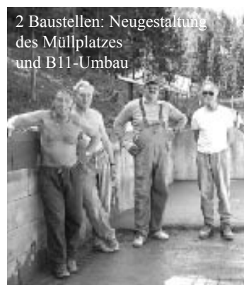
2 Baustellen: Neugestaltung des Müllplatzes und B11-Umbau