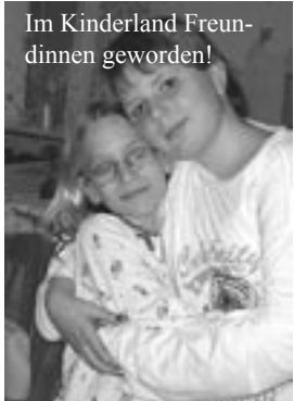
Im Kinderland Freundinnen geworden!