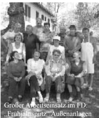
Großer Arbeitseinsatz im FD: „Frühjahrsputz“ Außenanlagen