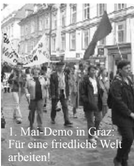
1. Mai-Demo in Graz: Für eine friedliche Welt arbeiten!

88 Kinder und Erwachsene nahmen am Ostereiersuchen in St. Peter-Freienstein teil. Bei diesem größten Osterspektakel des Ortes waren 180 Eier versteckt worden. Die Wanderung sowie das Geländespiel, bei dem man Pfeilen folgen und Briefe finden muss, sind alljährlich sehr beliebt!