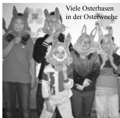
Viele Osterhasen in der Osterwoche