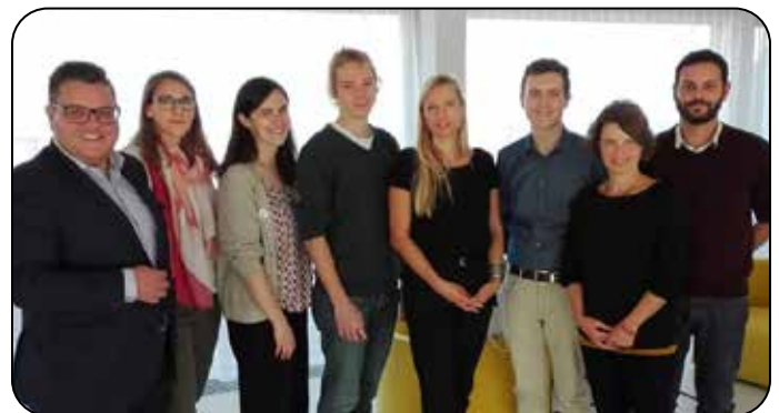
Besuch des LJB bei Dr. Juliane Bogner-Strauß in Wien, Okt. 2018

Personell hat sich für uns die Ansprechpartnerin geändert. Für die Jugendarbeit in der Steiermark ist künftig Frau Dr. Juliane Bogner-Strauß zuständig. Wir hoffen auch weiterhin auf eine gute und konstruktive Zusammenarbeit mit dem Land Steiermark und wünschen der neuen Landesrätin viel Erfolg in ihrer Arbeit.