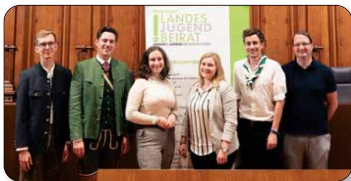
Neues Präsidium des LJB