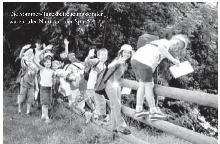
Die Sommer-Tagesbetreuungskinder waren „der Natur auf der Spur“

Den etwa 150 ehrenamtlichen MitarbeiterInnen sagen wir ein herzliches Dankeschön!